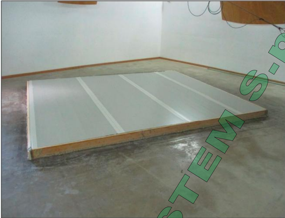
Fotografia dell'oggetto Photograph of item