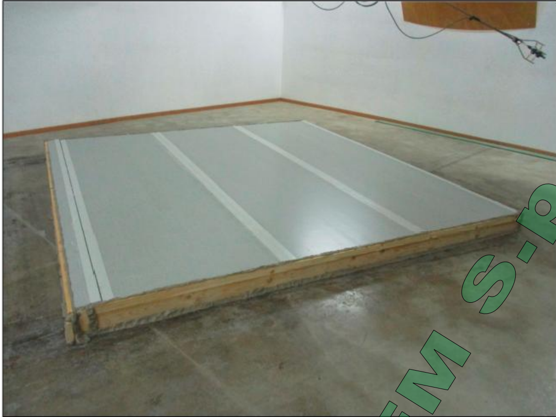
Fotografia dell'oggetto Photograph of item