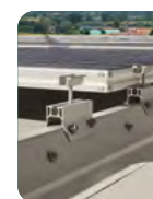
Eliosystem pag. 308

Per maggiori informazioni consultate il sito nav-system.it - For more informations visit www.nav-system.it